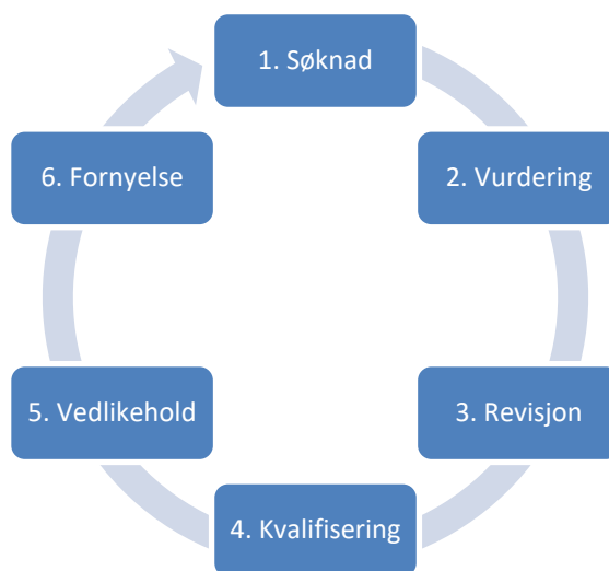
Figur 3-1 Hovedaktiviteter i kvalifiseringsprosessen

Nærmere beskrivelse av hovedaktivitetene er gitt i avsnitt 3.4 til 3.8.