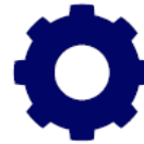
Tannhjul Utvikling/det operative leddet