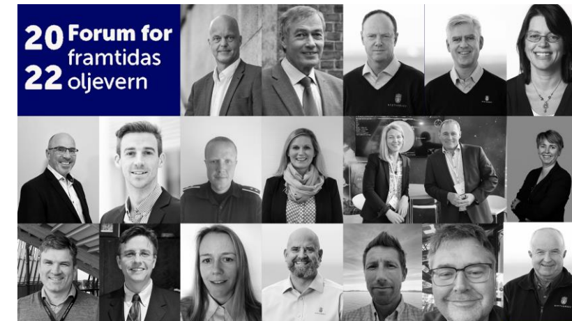
Veien videre - panelsamtale